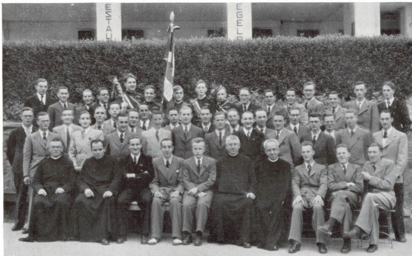
Bei der Gründungsfeier, vor der „Mühle“

unserer Vereinigung an historischer Stätte vollzogen. Viel Glück auf ein gutes Gedeihen; mögen die Hoffnungen, die auf diese Gründung gesetzt werden, restlos erfüllt werden!